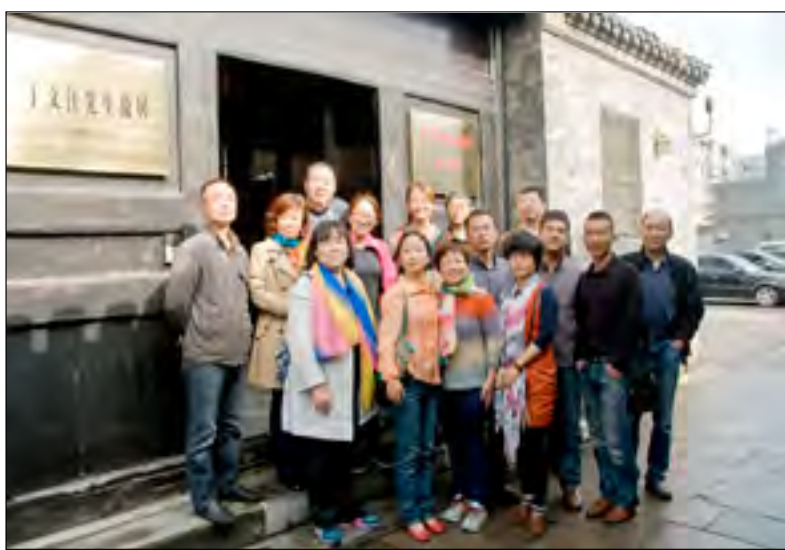
11月6日，常州市第五中学支部组织全体盟员赴泰兴参观黄桥战役新四军纪念馆，缅怀先烈的丰功伟绩，接受革命传统教育。

站在新的历史起点上，中共十八届三中全会对今后的发展作出总体部署。民盟市委将继续学习、缅怀、宣传、实践李公朴精神，准确把握建设高素质中国特色社会主义参政党的要求，弘扬李公朴等民盟先贤“奔走国是，关乎民生”的品格，与市委市政府同心同德，做挚友、献良策，彰显常州多党合作和政治协商制度的旺盛活力，努力把民盟常州市委的建设提高到一个新的水平。